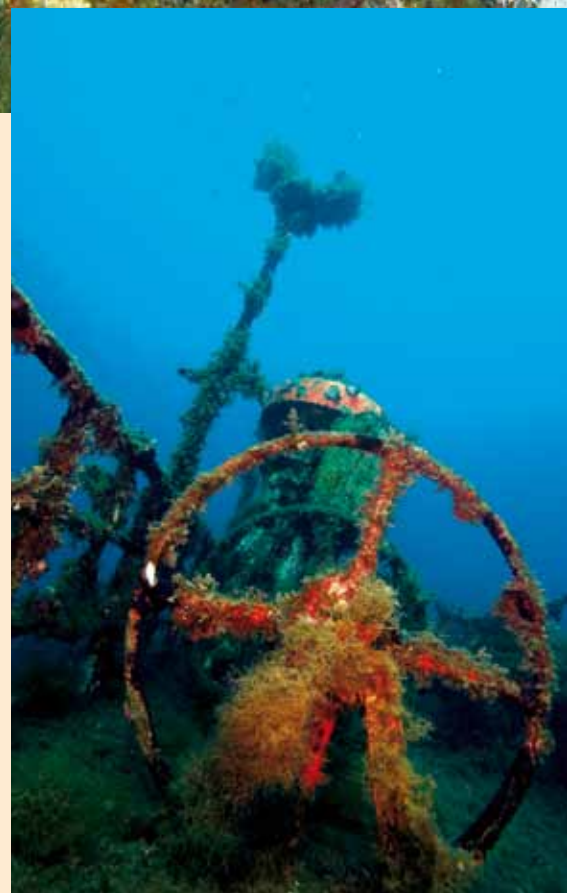
Il relitto è adagiato sul fondo a venti metri, in assetto di navigazione. Sopra, a sinistra, la gru di carico e, a destra, le iniziali sull'albero.

Prima di immergerci, però, è bene conoscere i fatti che portarono la nave al naufragio, un evento che con il tempo la trasformerà in un prezioso punto di ripopolamento per le specie ittiche e in uno dei più bei siti d'immersione della zona. 26 giugno 2007, porto di Ortona (Chieti). Il Tevfik Kaptan I , battente bandiera turca, molla gli ormeggi e fa rotta per l'Algeria con un carico di circa mille tonnellate di filo di ferro avvolto in bobine. Giunto davanti alle coste salentine, all'altezza di Torre Vado, il cargo, lungo ottanta metri, viene colto da un temporale. Il mare è molto mosso, il carico si sposta e fa sbandare pericolosamente la nave di circa quaranta gradi sul fianco sinistro. Sono le quattro del pomeriggio del 28 giugno quando il Tevfik Kaptan I , a un miglio dalla costa, s'inclina ulteriormente e inizia a imbarcare acqua. I sei uomini dell'equipaggio sono tratti in salvo e alle ventuno e trenta il mercantile affonda e si appoggia sul fondo, a soli venti metri, in assetto di navigazione. Immediatamente vengono attivate le procedure di emergenza per evitare un disastro ecologico causato dallo sversamento in mare degli idrocarburi contenuti nei serbatoi della nave. Circa