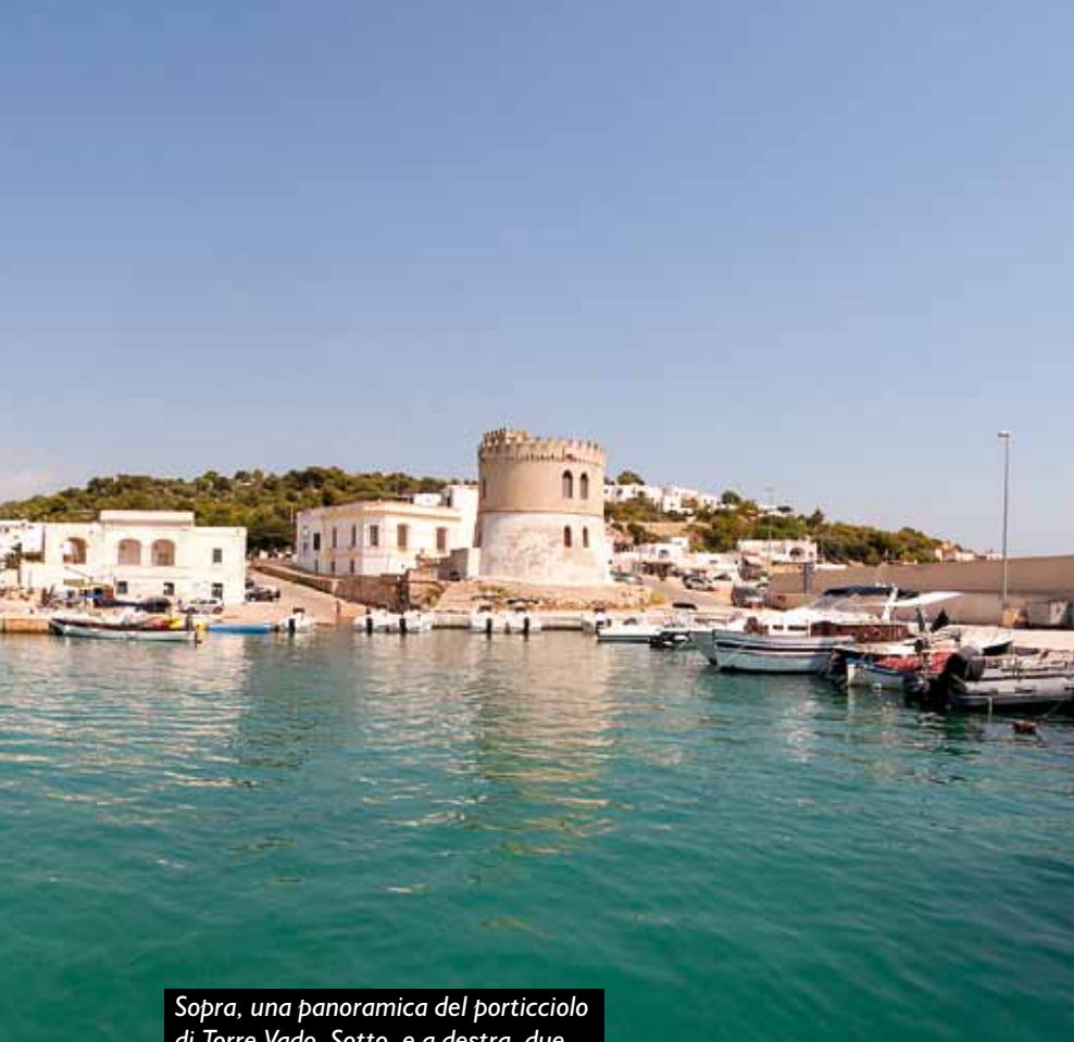
Sopra, una panoramica del porticciolo di Torre Vado. Sotto, e a destra, due scorci del relitto del Tevfik Kaptan I.